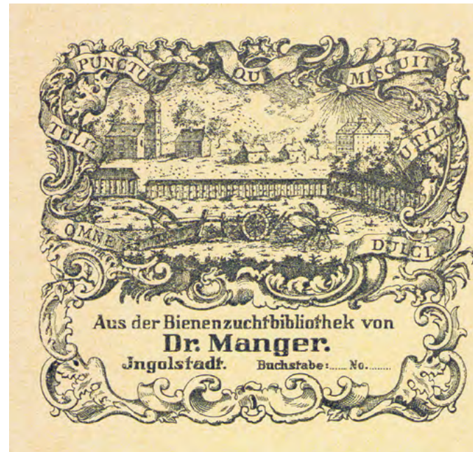
Exlibris Bartholomäus Manger