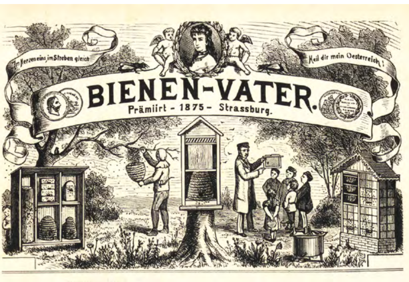
Titelseite der Zeitschrift ‚Bienen-Vater‘, 1880

Mitarbeiterin im Digitalisierungszentrum und im Projekt EODOPEN der Universitätsbibliothek Regensburg