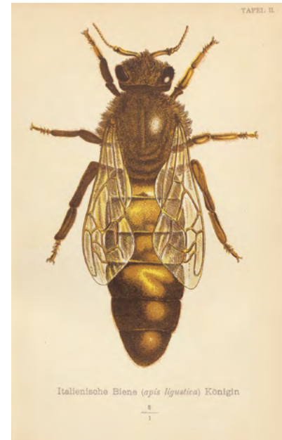
Italienische Biene (Drohne links, Königin rechts), aus dem ‚Atlas für Bienenzucht‘