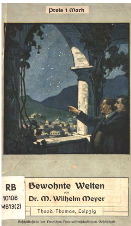
In seinem Werk ‚Bewohnte Welten‘ aus dem Jahr 1909 untersuchte Max Wilhelm Meyer die Möglichkeit von Leben auf unseren Nachbarplaneten. 7

Im Zentrum des Projekts stehen – neben der Klärung rechtlicher Aspekte und der Entwicklung technischer Lösungen – der Dialog mit den Nutzern und die Zusammenarbeit der Bibliotheken untereinander, wie dies auch im Förderprogramm ‚Creative Europe Culture‘ bestimmt ist. 8 Die verschiedenen Zielgruppen des Projektes sollen in die Auswahl der Werke einbezogen werden. Das erfordert eine intensive Öffentlichkeitsarbeit, um den Austausch zwischen den Bibliotheken, den Wissenschaftlerinnen und Wissenschaftlern und der Öffentlichkeit anzuregen. Dazu gehört z. B., dass besonders bemerkenswerte, neu digitalisierte Bücher über verschiedene