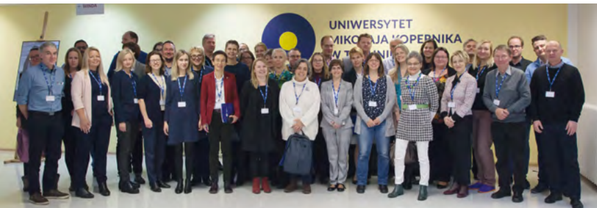
Die Teilnehmerinnen und Teilnehmer des Auftaktmeetings von EODOPEN in Toruń im November 2019

Kanäle, auch in den sozialen Medien, beworben werden. Seit kurzem bietet die Universitätsbibliothek Regensburg im Internet ein Digitalisierungswunsch-Formular an, mit dem Interessierte Buchvorschläge zur Digitalisierung einreichen können. 9 Dabei interessiert die Bibliothek nicht zuletzt die Frage, warum der betreffende Titel aus Sicht der oder des Vorschlagenden digitalisiert werden soll. Bei Digitalisierungsvorschlägen aus der Zeit von vor 1945 muss geprüft werden, inwieweit nationalsozialistisches Gedankengut enthalten ist und gegebenenfalls eine Abwägung getroffen werden, ob das betreffende Werk unkommentiert digitalisiert werden kann. Erste Aktivitäten der Öffentlichkeitsarbeit richteten sich auf den Kreis der Heimatpflieger, Archive und Museen in der Region um Regensburg, die Direktansprache der Lehrenden an der Universität ist in Vorbereitung. Naturgemäß ist die Zielgruppe auf die Geisteswissenschaften konzentriert, da die Naturwissenschaften voraussichtlich weniger Bedarf an Literatur aus der ersten Hälfte des vergangenen Jahrhunderts haben dürften. Der indirekte