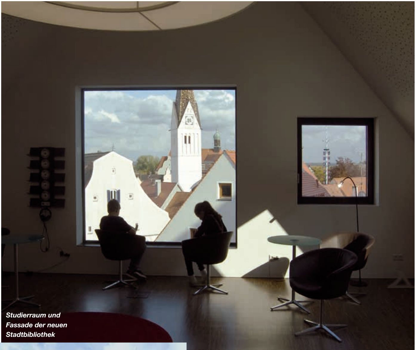
Studierraum und Fassade der neuen Stadtbibliothek