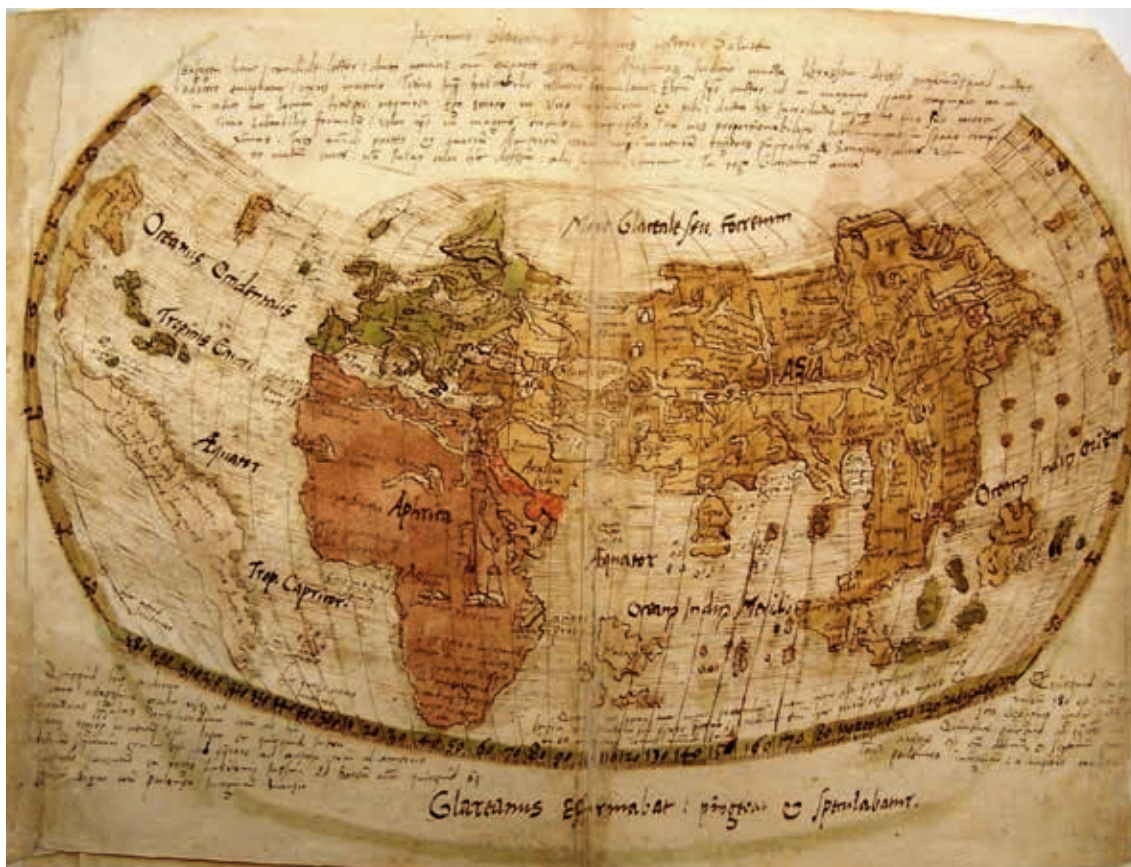
Glarean'sche Weltkarte in seiner Cosmographiae Introductio (Cim. 74).

Über die Herkunft der Globussegmentkarte der Universitätsbibliothek der LMU München gibt es momentan keine gesicherten Erkenntnisse. Die beiden Frühdrucke wurden im 19. Jahrhundert in einem Band vereint. Die Bedeutung der Waldseemüller'schen Karte erkannten die Münchner Bibliothekare damals nicht, und der Band versank im Dornröschenschlaf des Magazins und überstand unbeschadet die Auslagerung während des Zweiten Weltkriegs. In einer Luftschutzkiste mit der Nummer 340 gelangte das Werk im November 1942 zunächst nach Burghausen und im Februar 1944 nach Niederviehbach; es kehrte im September 1955 an die Bibliothek zurück und wurde eine Zeitlang im Nordostspeicher der LMU zwischengelagert. Ein Druck des Sammelbandes stammt aus dem Vorbesitz des Benediktinerklosters Oberalteich, aus dessen Bibliothek gut 1.400 Bände im Zuge der Säkularisation 1803 in die Universitätsbibliothek Landshut gelangten. Die Karte könnte aber auch im Zusammenhang mit einem anderen herausragenden Schmuckstück der Universitätsbibliothek stehen, nämlich der Cosmographiae Introductio aus dem Besitz